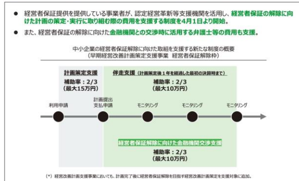
【図3】 経営者保証解除に向けた取組を支援する新制度を開始※1

最後に③事業承継特別保証制度の活用促進については、コロナ禍の影響も勘案し、当面は、事業承継特別保証制度のEBITDA有利子負債倍率(有利子負債がキャッシュフローの何倍あるのかを表す指標)要件について、現状の「10倍以内」から「15倍以内」へと緩和することが提言されています。