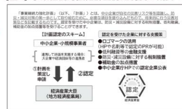
【図2】事業継続力強化計画認定制度の概要 ※5

事業継続力強化計画の具体的な策定方法については、事業継続力強化計画策定の手引きに記載されていますが、①事業継続力強化の目的の検討、②災害等のリスクの確認・認識、③初動対応の検討、④ヒト、モノ、カネ、情報への対応、⑤平時の推進体制を検討して計画に反映させていきます ※6 。