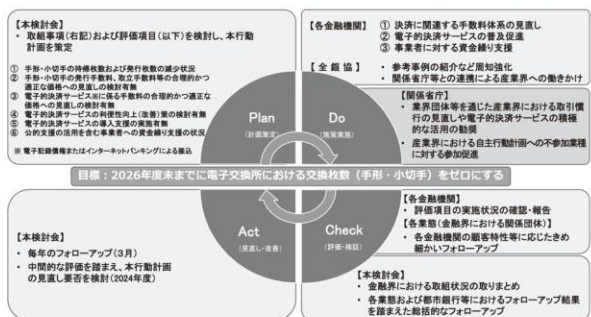
【図3】「手形・小切手機能の全面的な電子化に向けた自主行動計画」の全体像※6

紙の手形・小切手の利用廃止については、2021年6月18日に「成長戦略実行計画」で産業界及び金融界による自主行動計画の策定を求めることで、5年後(2026年)の約束手形の利用の廃止に向けた取組を促進する。と閣議決定されており、また、2023年6月9日に「デジタル社会の実現に向けた重点計画」において、決済については、法人インターネットバンキングの利用促進や手形・小切手の電子化に向けた取組を通じて