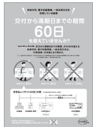
【図1】手形運用変更周知ポスター*4