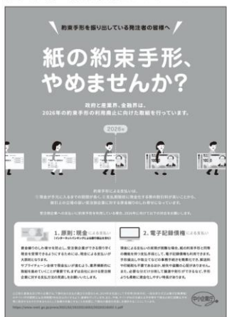
【図2】紙の約束手形、やめませんか?※5

紙の手形・小切手の利用廃止については、2021年6月18日に「成長戦略実行計画」で産業界及び金融界による自主行動計画の策定を求めることで、5年後(2026年)の約束手形の利用の廃止に向けた取組を促進する。と閣議決定されており、また、2023年6月9日に「デジタル社会の実現に向けた重点計画」において、決済については、法人インターネットバンキングの利用促進や手形・小切手の電子化に向けた取組を通じて